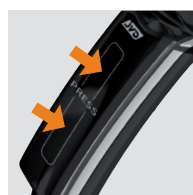
SYSTÈME DE POIGNÉE INTERRUPTEUR BREVETÉ